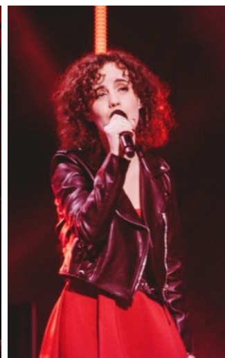
La chanteuse Héloïse CARION