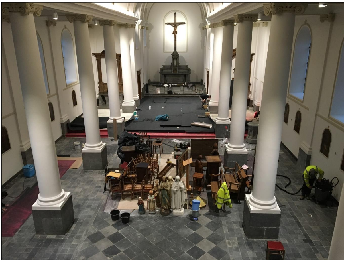
Etat actuel de l'église (photo du 15/12/2017)

L'église devrait être opérationnelle pour Noël.